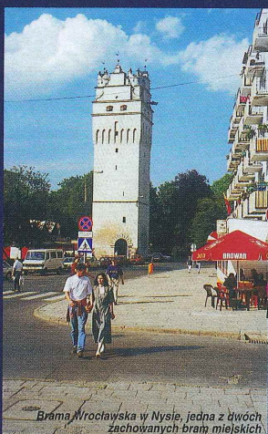
Brama Wrocławska w Nysie, jedna z dwóch zachowanych bram miejskich