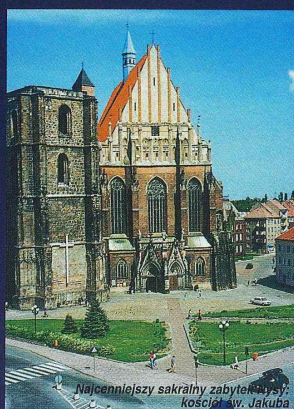
Najcenniejszy sakralny zabytek Nysy: kościół św. Jakuba