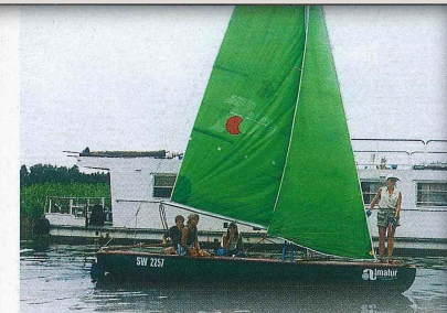
Załoga „Świata i Podróży” w pełnym składzie