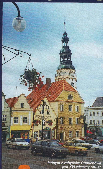
Jednym z zabytków Otmuchowa jest XVI-wieczny ratusz