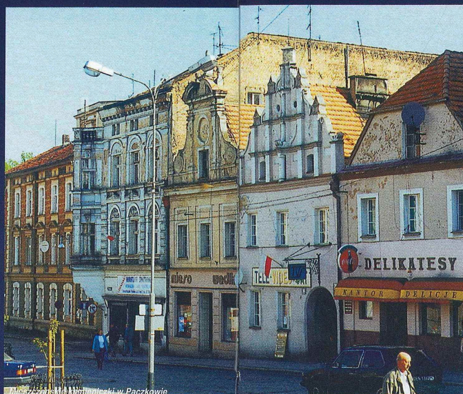
Miasto zabytków i muzealności w Paczkowie

Okolice Nysy w województwie opolskim to z pewnością jedno z ciekawszych zakątków południowo-zachodniej Polski. Rozpocierający się niemal wzdłuż granicy z Czechami region oferuje szerokie możliwości wypoczynku na łonie natury, kontaktu z przyrodą, o każdej porze roku. Urozmaicona rzeźba terenu – od rozległych nizin przez płaskowycze po krajobraz górski – stwarza dogodne warunki dla wszystkich bez mała rodzajów turystyki. Przeważa turystyka piesza, którą ułatwiają liczne i dobrze utrzymane znakowane szlaki, choć gęsta sieć dróg przy braku na ogół stromych podjazdów sprzyja z kolei uprawianiu kolar-