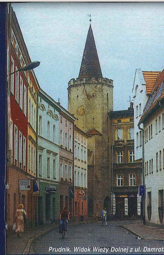
Prudnik. Widok Wieży Dolnej z ul. Damrota