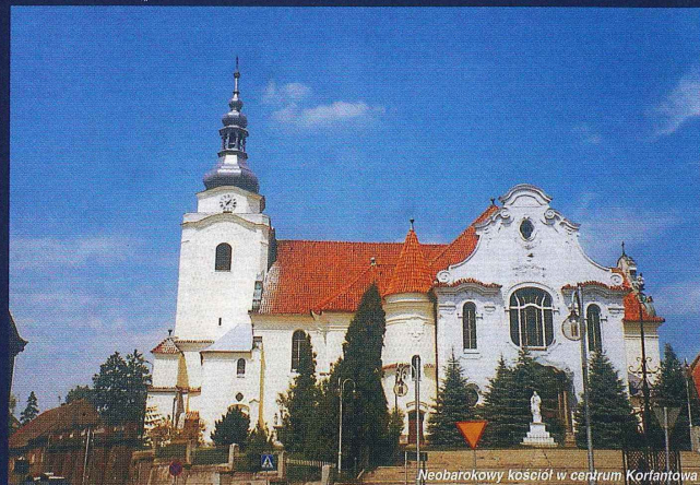
Neobarokowy kościół w centrum Kortkowa